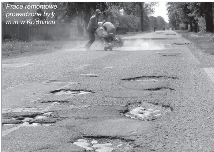
Prace remontowe prowadzone były m.in. w Koźmińcu