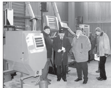
(tw) Wystawa kotłów pleszewskich na Wołyniu

W drodze powrotnej delegacja pleszewska spotkała się w stolicy Wołynia - Łucku z konsulem generalnym RP na Ukrainie Wojciechem Gałką.