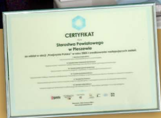
Certyfikat „Przejrzystej Polski” dla Powiatu Pleszewskiego s. 3