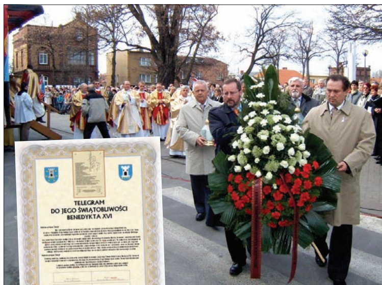
Po mszy starosta, burmistrz, przewodniczący rady miejskiej i rady powiatu złożyli wieniec pod „Tablicę papieską”.