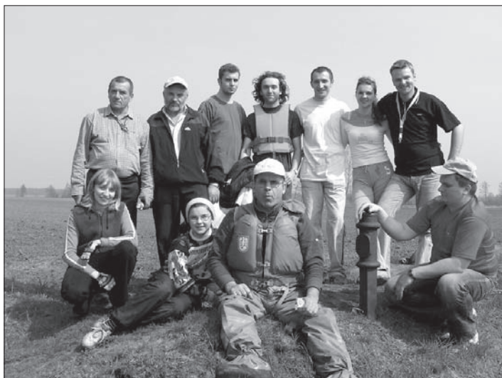
Uczestnicy spływu zrobili sobie odpoczynek w okolicach Piły przy starym szańcu granicznym z czasów zaborów

Tegoroczny sezon kajakowy i wędkarski nad Prosną oficjalnie rozpoczęto w sobotę 22 kwietnia. Dopisała piękna słoneczna pogoda. Wędkarze z Chocza od rana łowili ryby nad Prosną. Tymczasem w oddalonym o kilkanaście kilometrów Bogusławiu kajakarze przygotowywali się do spływu. Jego