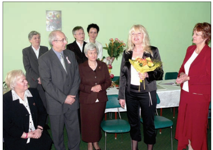
Pleszewianki przyjęły gratulacje m.in. od koleżanek z kaliskiego Koła Amazonek