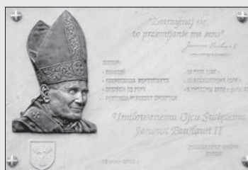
Tablica pamiłtkowa na cześć Jana Pawła II w Choczu