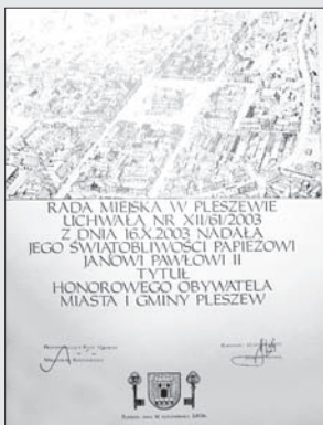
Papież Jan Paweł II - Honorowy Obywatel Miasta i Gminy Pleszew