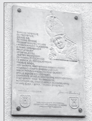
Tablica pamiłtkowa pielgrzymek do Rzymu w Pleszewie (tzw. „Tablica papieska”)