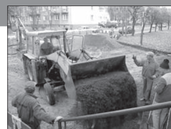
Remont placu przed wejściem do Zespołu Szkół Technicznych przy ul. Zielonej w Pleszewie - 23.000 z 3