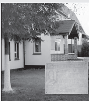
Gimnazjum im. Jana Pawła II w Gizałkach