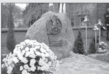
Obelisk ku czci Jana Pawła II w Jedlcu