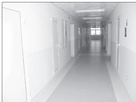
Oddzia³ wewnêtrzny po remoncie

Remont przeprowadzono w skrzydle, przeznaczonym dla mę¿czyzn. Wszystkie sale chorych s¹ wymalowane i posiadaj¹ odrêbne żazienki z toaletami i natryskami. Pod³ogi wy³o¿ono wyk³adzin¹ bezspoinow¹ typu TARKETT Option, która znacznie ułatwia utrzymanie re¿imu sanitarnego. Wymie-