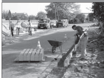
Przebudowa chodnika wzdłuż drogi nr 13145 w m. Galew - 80.000 z 3