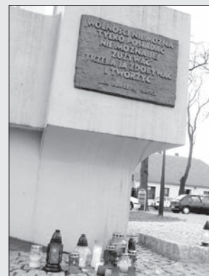
Plac Wolności im. Jana Pawła II w Pleszewie

68840900010000183420000001 z dopiskiem „Aleja Jana Pawła II”