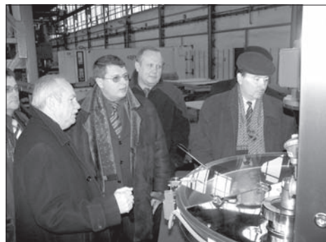
Goście z Ukrainy zwiedzili m. in. FMS „Spomasz”

dzie kotłarskim EKOCENTR w Piekarzewie oraz w Spółdzielni Mleczarskiej w Kowalewie. Wieczorem w „Starej Stajni” w Zawidowicach przygotowano dla nich koncert w wykonaniu zespołów „Etanis” i „Pod prąd” oraz chóru „Ave Sol”. Delegacja wyjechała z Pleszewa w sobotę 10 grudnia rano. (tw)