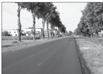
Przebudowa drogi nr 13318 Brzezie – Janków (dwa odcinki z Brzezia do Pleszówki i w Bogusławiu, łącznie 4,1 km, wraz z chodnikiem w Brzeziu i przystankami autobusowymi w Brzeziu, Pleszewie i Bogusławiu) - 1.296.359 z 3