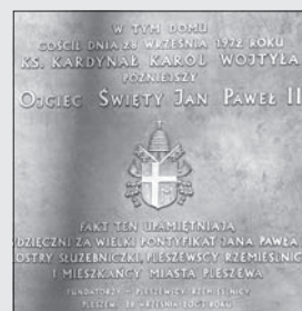
Tablica w klasztorze sióstr sążebniczek w Pleszewie