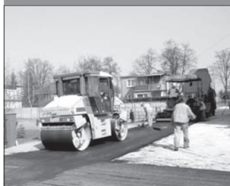
Modernizacja części ul. Osiedlowej w Pleszewie (pomiędzy ul. Poznańskiej a ul. Zieloną) - 77.850 z 3