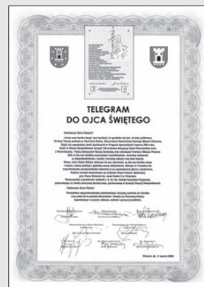
Telegram do Ojca Świętego z 11 marca 2005r.