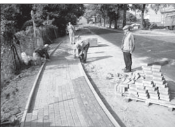
Przebudowa chodnika przy ul. 24 Stycznia w Kowalewie (140 mb) - 60.000 z 3