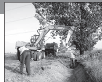
Przebudowa drogi nr 13304 na odcinku od m. Nowy Ćwiat do granicy Powiatu (1,7 km) - 610.000 z 3