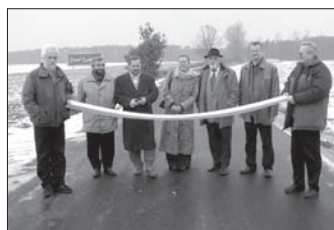
Przebudowa drogi nr 13315 na odcinku Zawidowice – Grodzisko (dł. 1,7 km) - 200.000 z 3