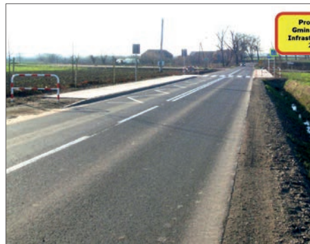
W uroczystym otwarciu dróg Kuchary - Kucharki i Dobrzyca - Koryta w dn. 19 grudnia 2017 r. uczestniczyła Wicewojewoda Wielkopolski Marlena Małag .

Droga powiatowa 4348P Kuchary - Kucharki (2 km) / 2.450.144 zł (PRGiPID - 1.213.381 zł, powiat - 624.005 zł, Gołuchów - 612.758 zł):