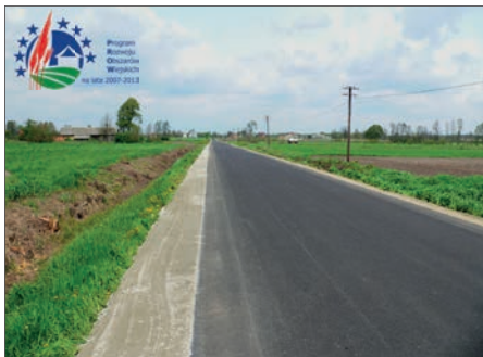
Oficjalne oddanie drogi do użytku nastąpiło 23 listopada 2017r. w Starej Kąźmierce z udziałem Wicemarszałka Województwa Wielkopolskiego Krzysztofa Grabowskiego .

Droga powiatowa 4310P Chocz - Józefów (2,63 km) / koszt 976.473 zł (PROW - 619.833 zł, budżet powiatu - 249.648 zł, Chocz - 106.992 zł):