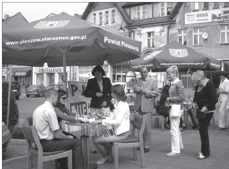
Zbiórka podpisów pod obywatelskim wnioskiem ustawodawczym „Nie dla likwidacji sądów” (Pleszew, rynek, 22 lipca 2012r.)