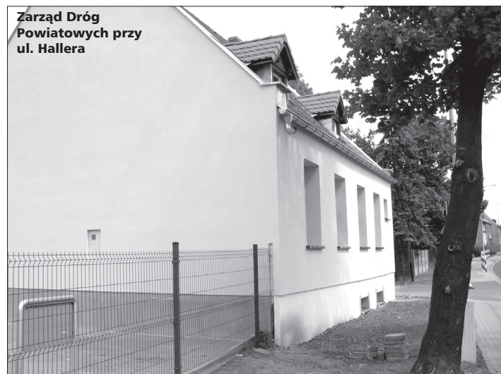
Zarząd Dróg Powiatowych przy ul. Hallera