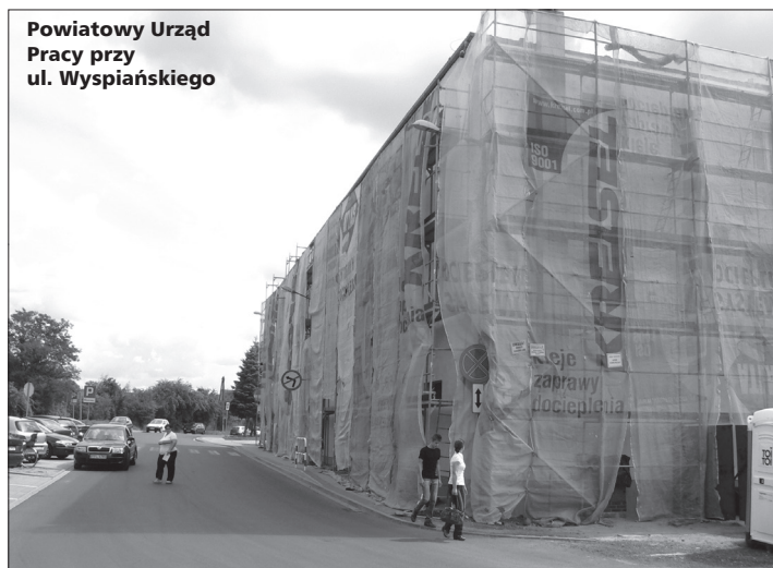
Powiatowy Urząd Pracy przy ul. Wyspiańskiego