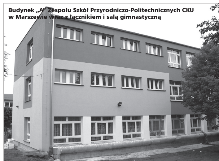
Budynek „A” Zespołu Szkół Przyrodniczo-Politechnicznych CKU w Marszewie wraz z łącznikiem i salą gimnastyczną