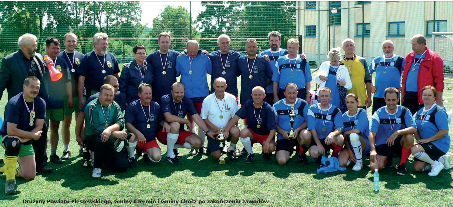
Drużyny Powiatu Pleszewskiego, Gminy Czermin i Gminy Chocz po zakończeniu zawodów

Wielkopolskie Dni „STOP - Uzależnieniom” odbyły się 1 czerwca 2012 roku w Zespole Szkół Technicznych w Pleszewie. Była to już dwunasta edycja tej imprezy. Organizatorem tradycyjnie jest Starostwo Powiatowe w Pleszewie. Tegoroczne WDSU przebiegło pod znakiem sportu i hasłem „Tylko słabi gracze biorą dopalacze”. Zorganizowano zawody sportowe szkół ponadgimnazjalnych: turniej piłki nożnej chłopców na „Orliku” oraz rozgrywki piłki siatkowej dziewcząt w sali sportowej.