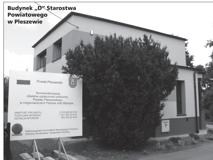
Budynek „D” Starostwa Powiatowego w Pleszewie