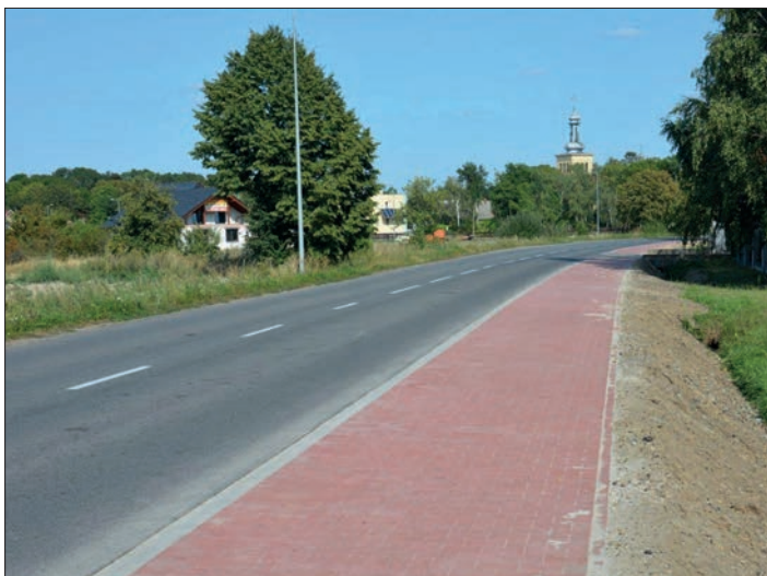
Kowalew. Nowy chodnik przy ul. Fabianowskiej o długości 360 mb