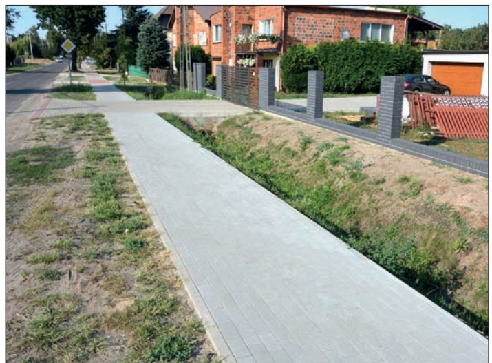
Nowy chodnik w miejscowości Brzezie (280 mb)